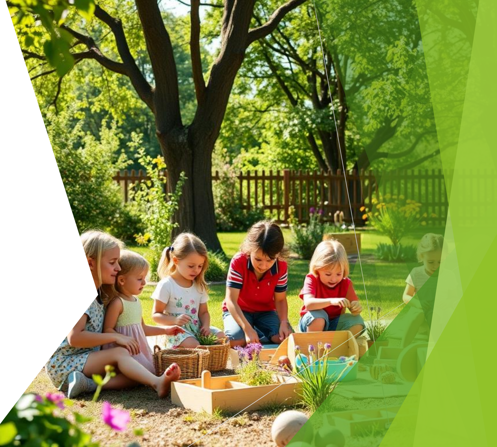
Abb. 5: Waldorfpädagogik 2