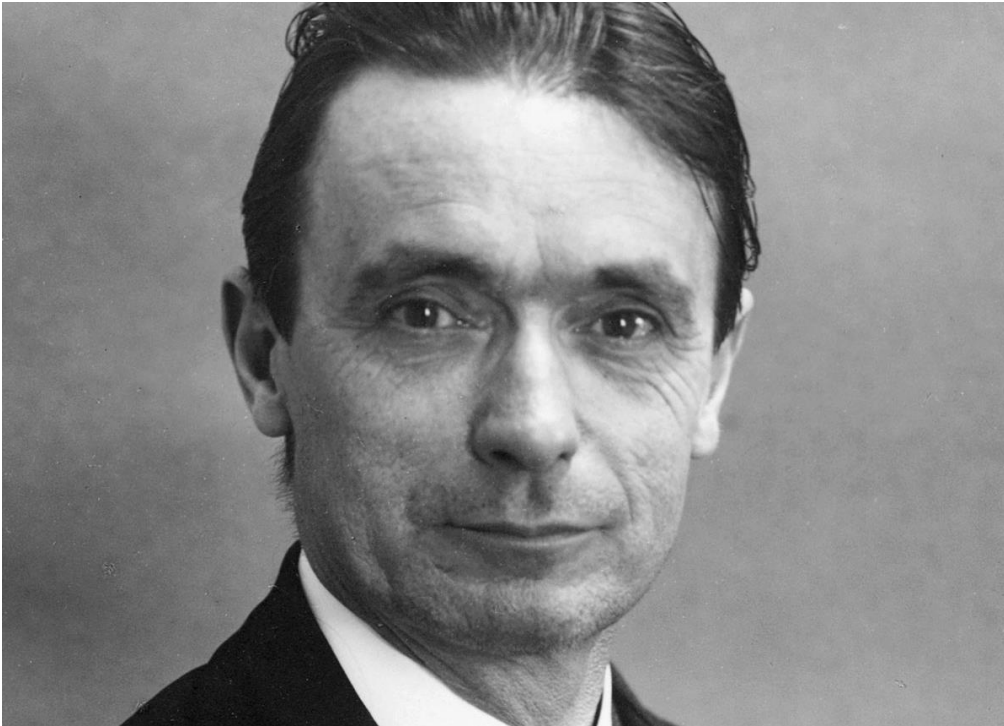
Abb.2: Rudolf Steiner