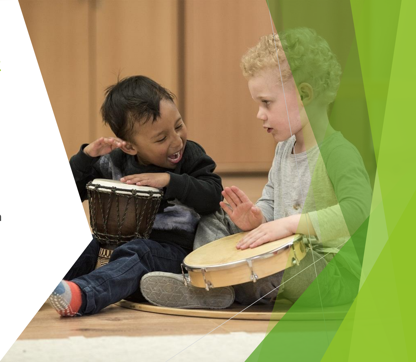
Abb. 7: EMP Beispielbild