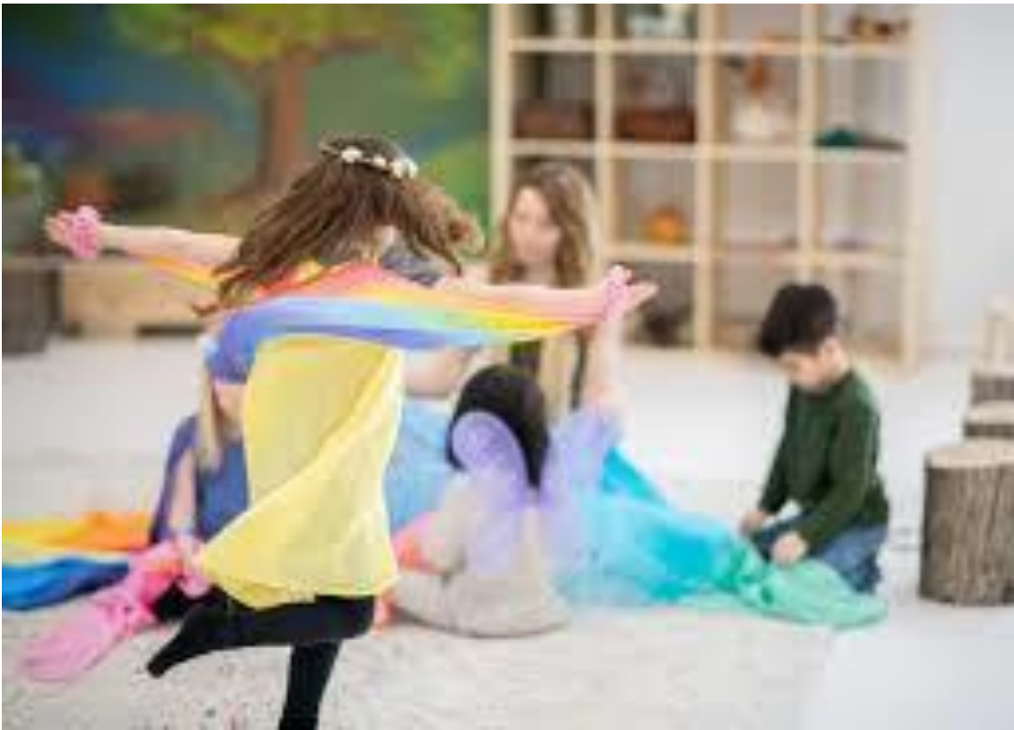
Abb. 4: Waldorfpädagogik 1