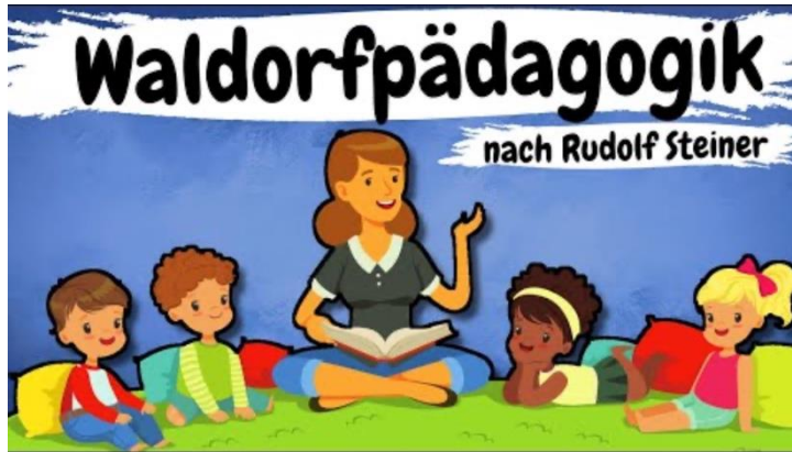
Erzieherkanal - Wissen, Theorien & Infos