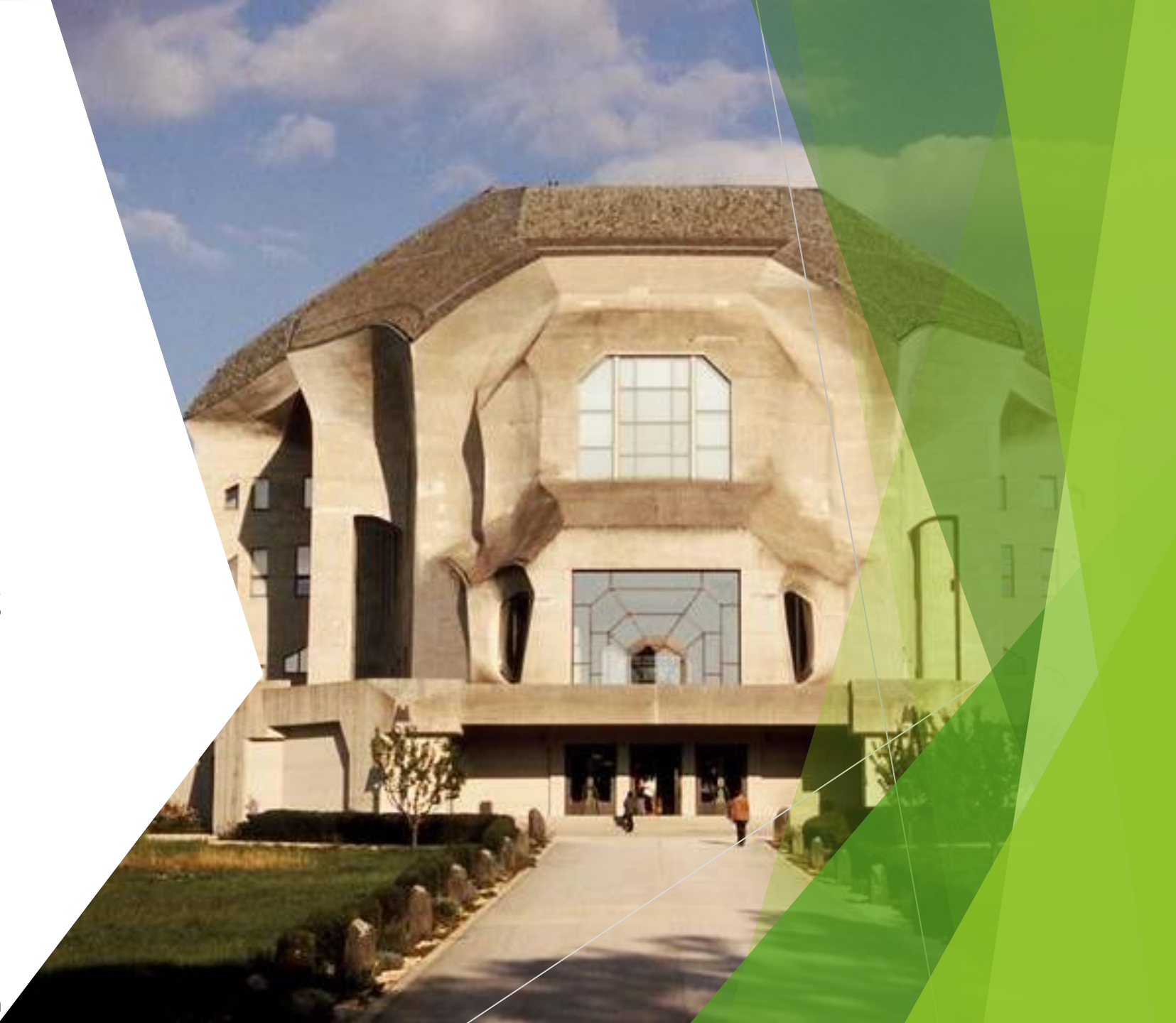
Abb. 3: Goetheanum in Dornach