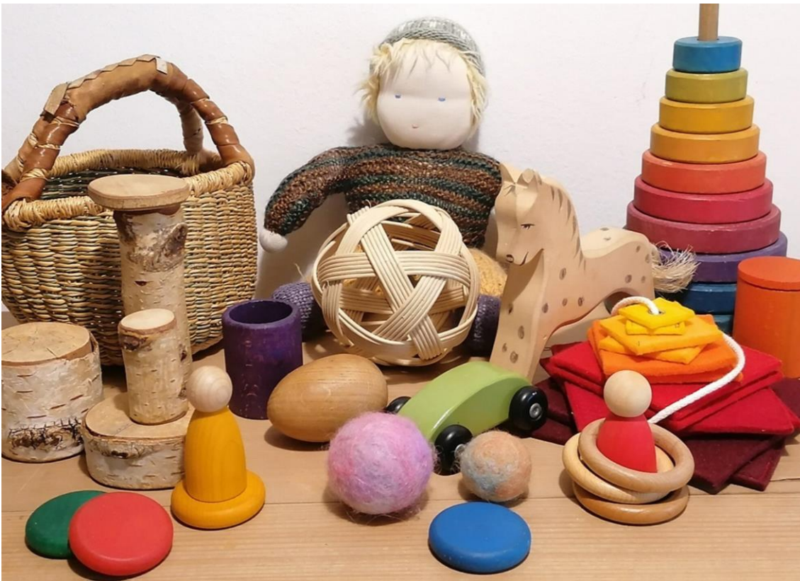
Abb. 6: Waldorf-Spielzeug